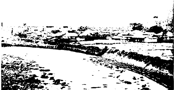
③【渋川の棚下】 棚下集落(右岸からの遠景) カスリーン台風時に集落の一部に 浸水被害があったが、堤防はない。 すぐそばに段丘があるので、浸水が広がることない。