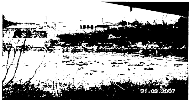
⑥【前橋・高崎の昭和大橋】 昭和大橋の左岸下流 浸食崖が形成され、掘り込み河道になっているので、 堤防はない。