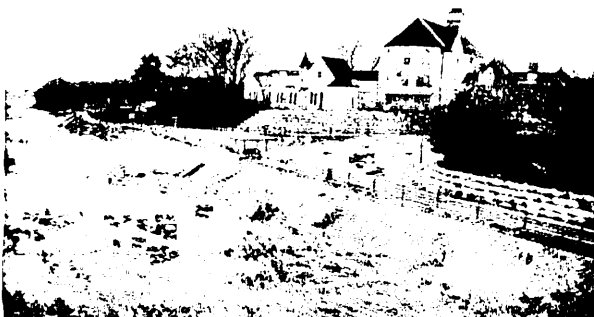
⑤【前橋の南部大橋】 南部大橋の右岸下流 浸食崖が形成され、掘り込み河道になっているので、 堤防はない。