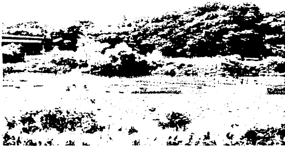
①【月夜野から沼田まで】 地蔵橋右岸上流部の浸食崖 集落は崖の上の台地にある。堤防はない。