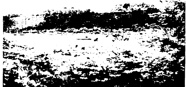
④【渋川の坂東橋】 坂東橋左岸の浸食崖 高い浸食崖なので、堤防はない。